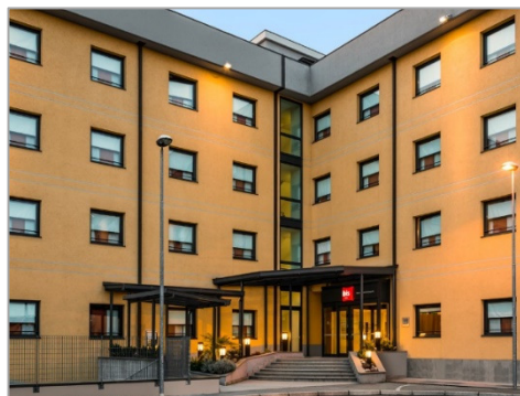
Hôtel Milano Malpensa

Pour 4 jours, hébergement à l'Hôtel IBIS Milano Malpensa. Le tarif comprend l'hébergement, la restauration, le transport, l'accompagnement et les visites.