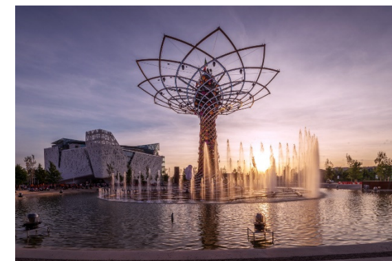
Expo. Universelle, Arbre de Vie