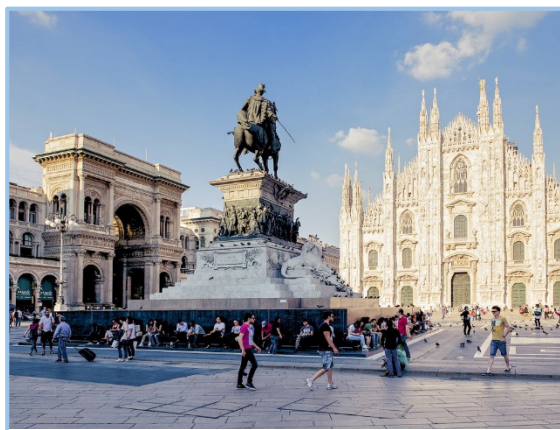
Place Duomo et sa Cathédrale

L'Expo 2015 offrira aux visiteurs la chance d'effectuer un véritable voyage autour du monde à travers les saveurs et les traditions des peuples de la Terre.