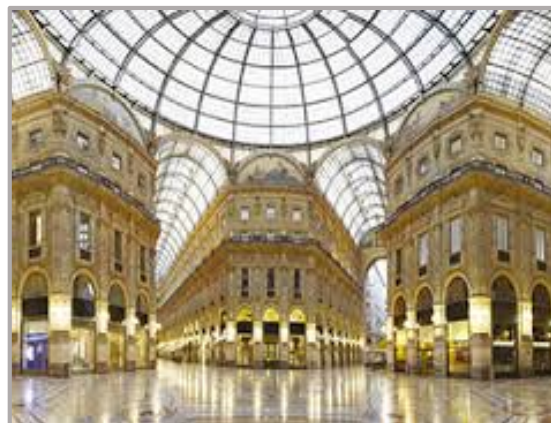
Galerie Vittorio Emmanuele II